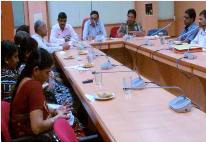
हिन्दी दिवस समारोह 2013 के उपलक्ष्य में सांस्कृतिक कार्यक्रम के अंतर्गत कविता एवं गीत का आनन्द लेते हुए अधिकारी एवं कर्मचारी गण